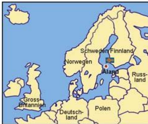
Die Aland-Inseln liegen in der Ostsee auf halbem Weg von Schweden nach Finnland

Die Entmilitarisierung der Aland-Inseln geht auf den Krim-Krieg zurück,