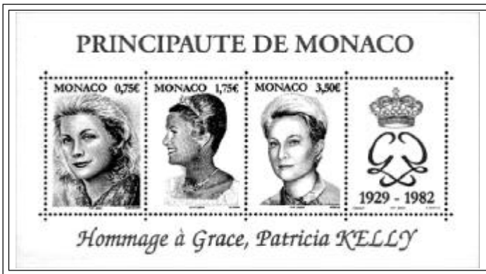
Grace Kelly - die spätere Fürstin Gracia Patricia von Monaco

Fürst Rainier III. hat 56 Jahre lang die Geschicke seines Fürstentums bestimmt und aus dem Zwergstaat Monaco eines der reichsten Länder der Welt gemacht. Sein Leben und Wirken lassen sich ebenso philatelistisch dokumentieren wie das von Papst Johannes Paul II. (siehe Seiten 6 und 7).